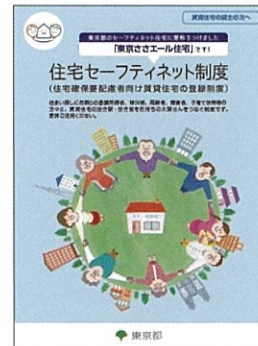
住宅セーフティネット制度