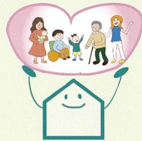
居住支援法人一覧 (東京都HP)