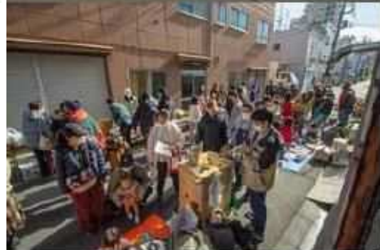
情報発信スペース運営の様子