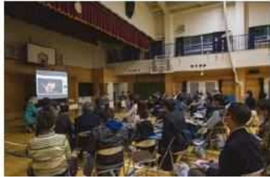
第二回勉強会の様子