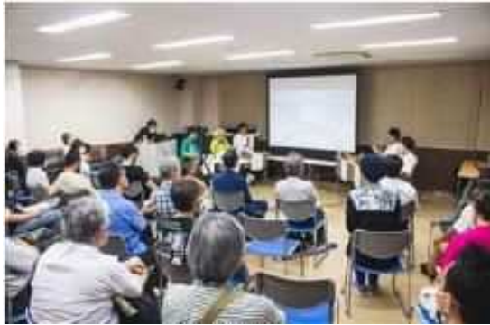
第一回勉強会の様子