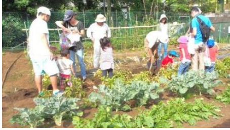
空き地を利用した菜園