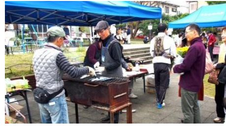
今泉台マルシェの様子