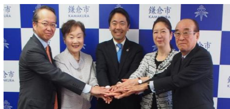
報道発表時の集合写真