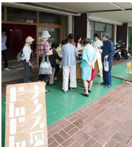
（出典）：UR 都市機構 HP