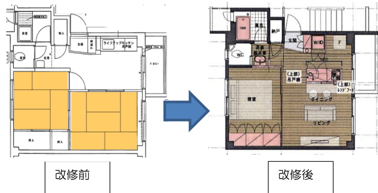
【リノベーション住戸プラン例】