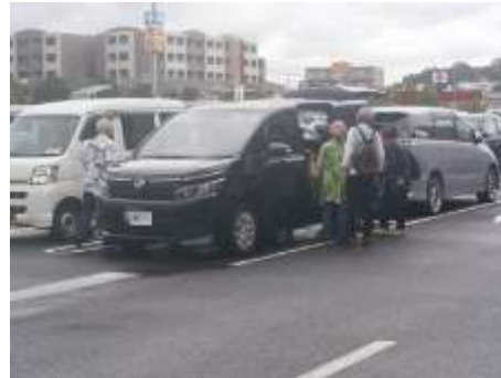
スーパーでの様子