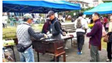
今泉台マルシェの様子