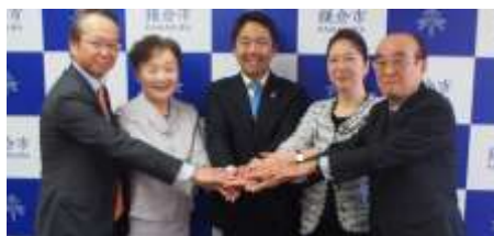
報道発表時の集合写真