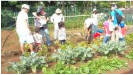
空き地を利用した菜園