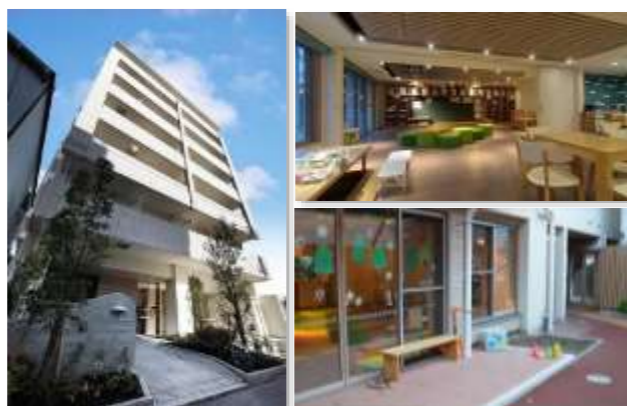
「東京都子育て支援住宅認定制度」認定住宅の例