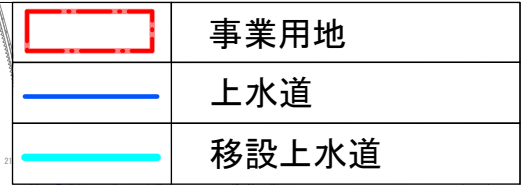
添付資料 7-1 将来上水道図