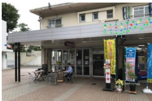
【ほっとさこんやまの外観】