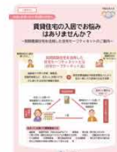
入居者向けパンフレット