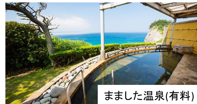
まました温泉(有料)