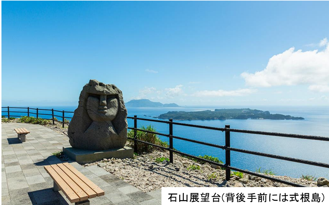
石山展望台(背後手前には式根島)

東京都心から約160km南下した場所に位置しており、新島・式根島の2島からなる村です。