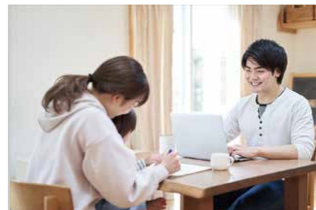
テレワークの環境整備による職住の融合イメージ