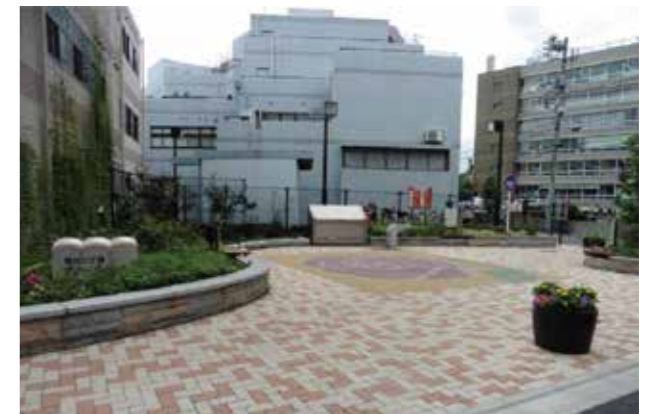
荒川二丁目グリーンスポット