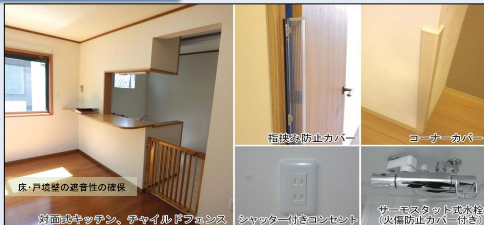
床・戸境壁の遮音性の確保