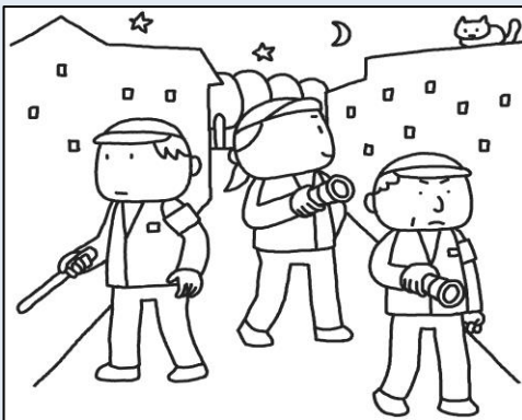
地域活動が活発に行われている