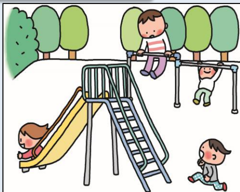
公園など遊び場が近くにある