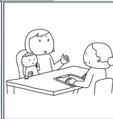
子育て相談サービス等の提供