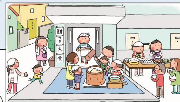
居住者同士・地域交流機会の創出