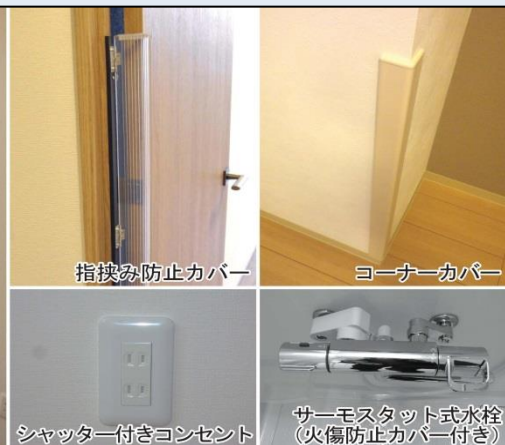
指挟み防止カバー