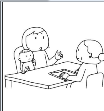
子育て相談サービス等の提供