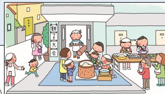
居住者同士・地域交流機会の創出