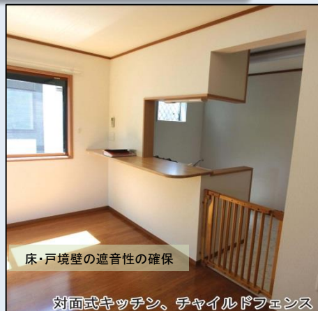
床・戸境壁の遮音性の確保