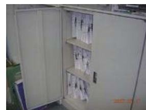
(鍵付キャビネット)