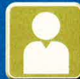
解雇等による 住居退去者世帯