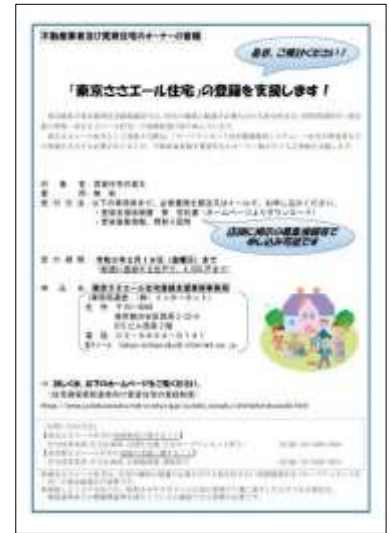
登録支援実施の案内チラシ