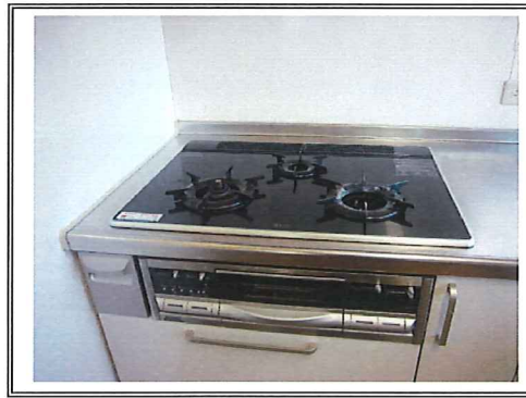
マイホーム借上げ制度 相模原事例その②