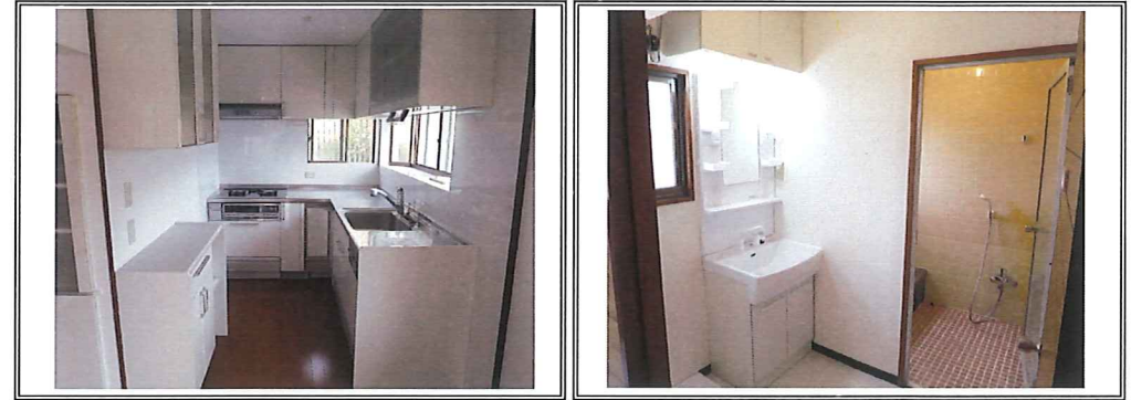
マイホーム借上げ制度 相模原事例その④