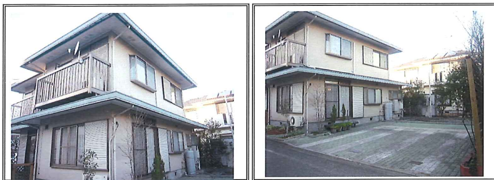
マイホーム借上げ制度 相模原事例その①