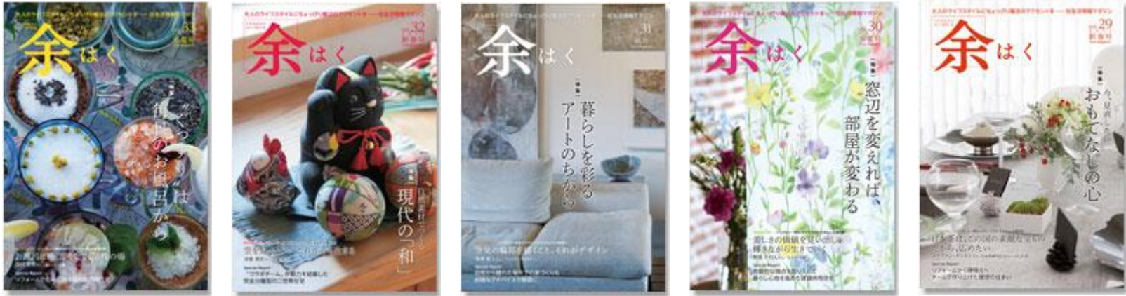
住生活マガジン「余はく」の発行