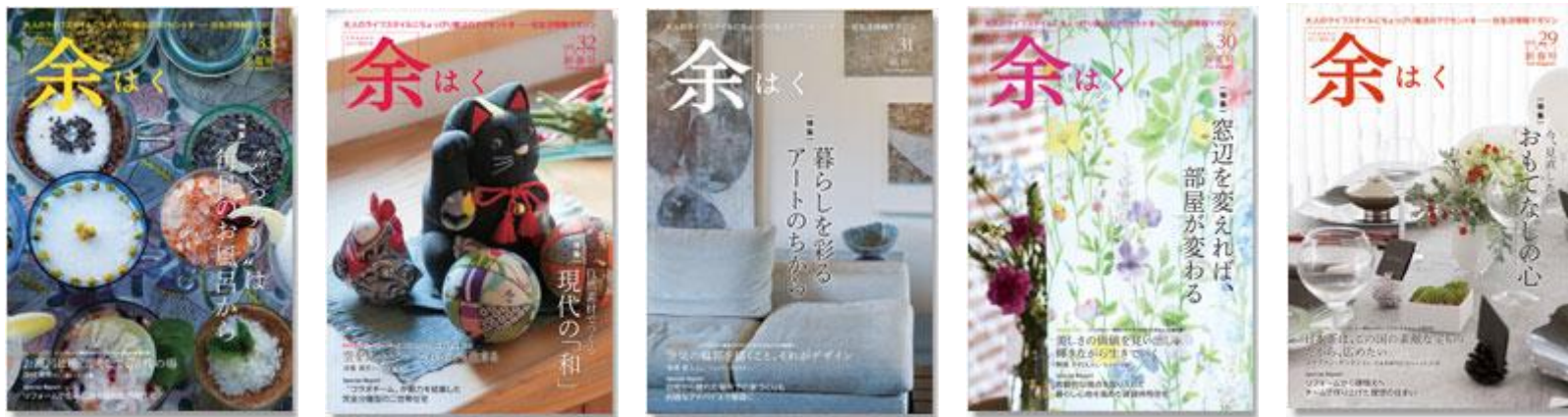
住生活マガジン「余はく」の発行